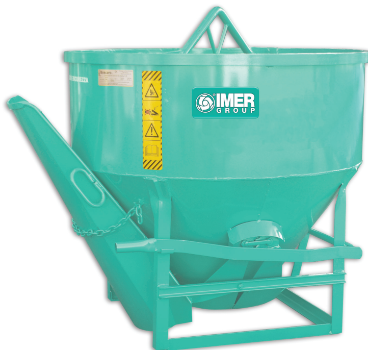
Benne conique à fond ouvrant avec goulottes latérales